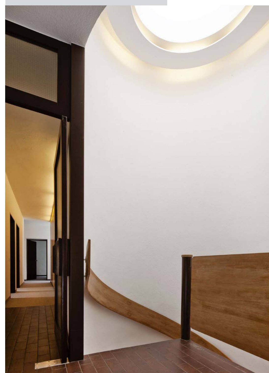
Eingangsbereich mit Wendeltreppe