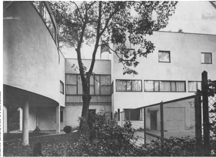
4 — Villas La Roche-Jeanneret, premier plan: dessin de perspective / first sketch: perspective plan 5 — Les maisons La Roche et Jeanneret / La Roche and Jeanneret Houses 6 — Hall et passerelle / Hall and galleried walkway 7 — La salle à manger / The dining room 8 — Galerie d'art / Art gallery