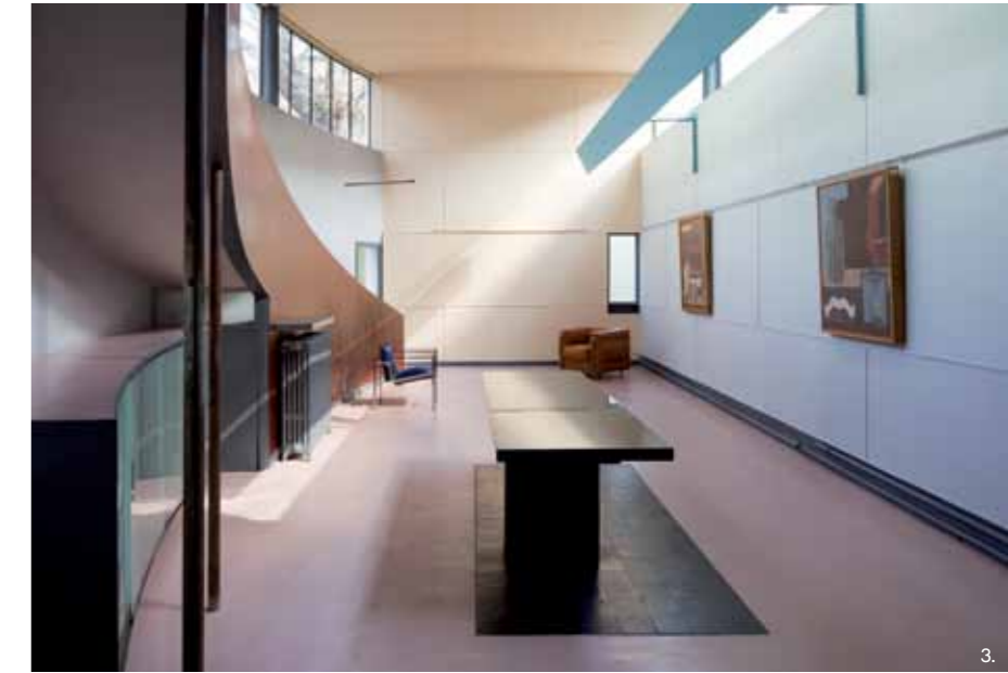
1-3 Olivier Martin-Gambier © FLC/ADAGP

Fondation Le Corbusier: www.fondationlecorbusier.fr