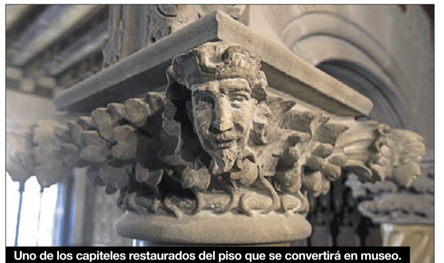
Uno de los capiteles restaurados del piso que se convertirá en museo.