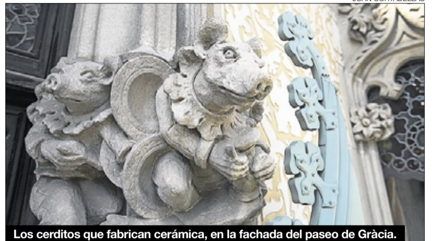
Los cerditos que fabrican cerámica, en la fachada del paseo de Gràcia.